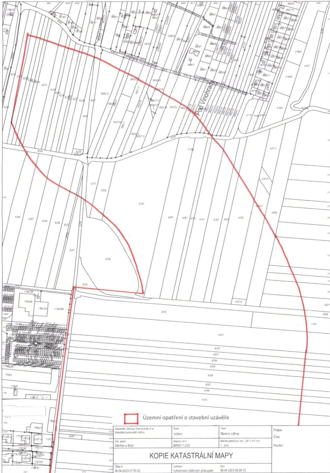
Příloha č. 1 - Vymezení hranice stavební uzávěry, část 1